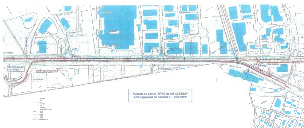
Annexe 1 – Vue en plan secteur 5 et piste cyclable

Cette voie cyclable sera positionnée en rive gauche du Nant de Gillon, entre l'échangeur Epagny 3 et la bifurcation vers Gillon. Le plan en annexe précise le tracé de cette voie qui sera séparée de la circulation routière par un muret béton ( annexe1).